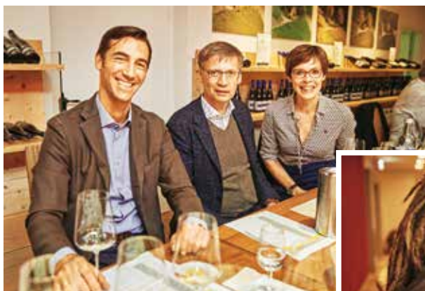
3-Sterne-Sommelier trifft TV-Moderator Stephane Gass aus Baiersbronn mit Dorothea und Günther Jauch während des Finales. Die Jauchs sind seit 2010 Riesling-Winzer an der Saar