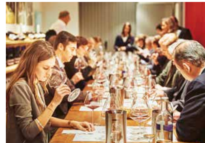
Konzentrierte Kompetenz 20 Juroren vergaben im Finale Punkte. Die Experten wussten nicht, von welchen Produzenten die Weine stammten, die sie vor sich hatten